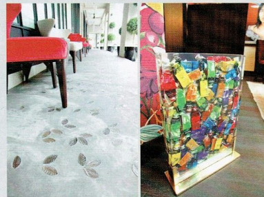
房裏不只平面作品，像 Vagabond Suite 裏，放置了這幅顏料的玻璃畫。