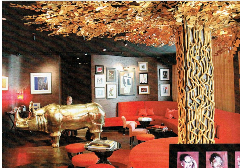
該酒店，就曾經到 Jacques Garcia 設計的金邊奧多牛，兩地地地住了 18 個月，其時，酒店還在 2010 年獲獎。