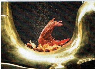
「Carabinero Prawn」，用西班牙大紅蝦搭其自家製的 chorizo 香腸，是 5th Quarter 的名菜，約 138 港元。

酒店除了樓下的 lobby，晚上還有高級餐廳 5th Quarter 和 bar，早上則是用早餐的地方，在海邊的現代藝術下午茶，同時吸收著藝術精華。