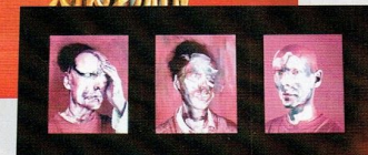
牆上塗上顏料，活起來的鮮活畫，原來是藝術家的裝置藝術影片。