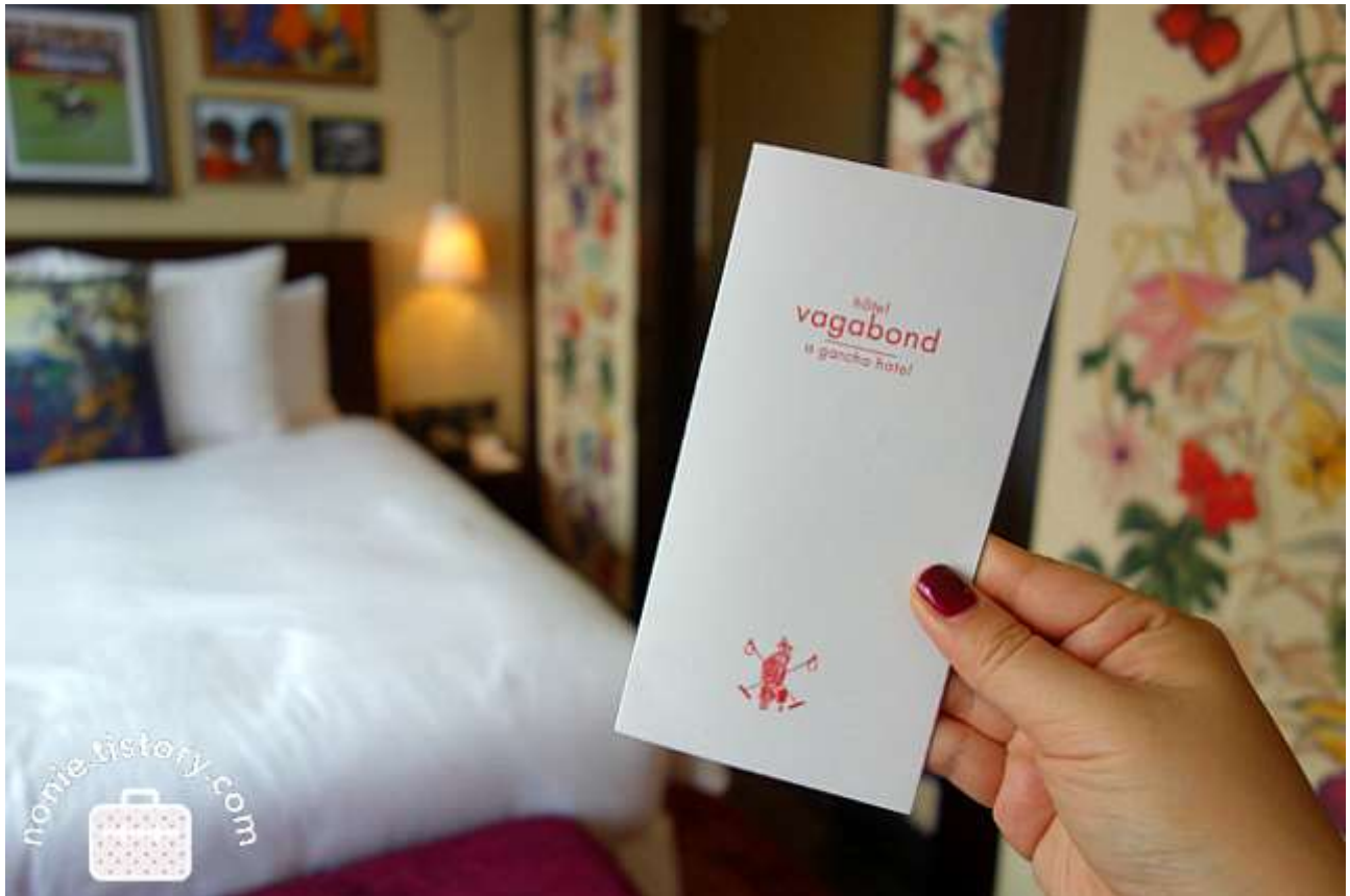
리틀 인디아 깊숙히 자리잡은 신상 호텔, 베가본드