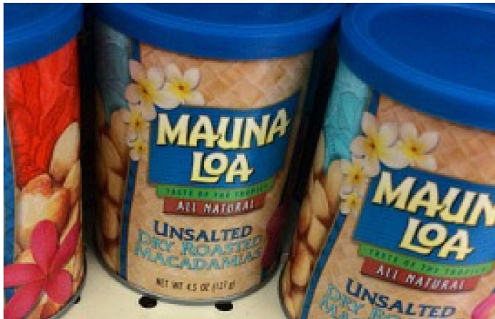
하와이 쇼핑놀이! 나만의 새로운 쇼핑 스.. nonie