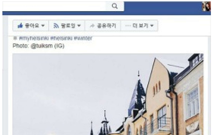
핀란드로 떠나는 겨울여행 준비하기 - 핫.. nonie