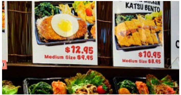
하와이 맛집투어! 알라모아나 센터 신상 .. nonie