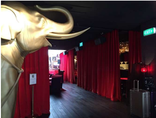
圖為位於檳城的小印度 (Little India)，高樓的樓層多由本地藝術家、新加坡及外國人，在 Hotel Vagabond 酒店內及酒店外由法國設計師 Jacques Garcia 設計。其中樓層還用了 Pretty Woman “漂亮女人”電影入畫用的漂亮屏風，這1990年美國被視言劇是美國影壇女星 Julia Roberts 茱莉亞·羅伯茲的成名作。