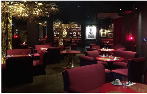
我们期待与您见面，从中午至凌晨，我们为您提供美食，我们期待您的光临。 我们期待您的光临，早上10:30至凌晨2:00，我们为您提供美食，我们期待您的光临。