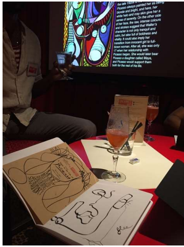
晚上参加了A Night in the Life of PICASSO 的装置event - Hotel Vagabond 会有不同的藝術家 Workshops/Events 除 / PICASSO, 會有SALVADOR DALI 或其他Artists, 项目除了有趣更有教育意义...